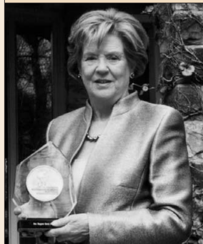
L'Honorable Margaret Norrie McCain, récipiendaire de la médaille du CEDJE.

L'Honorable Margaret Norrie McCain s'est toujours consacrée à la défense du bien-être des enfants, tant à titre de lieutenant-gouverneur du Nouveau-Brunswick que de travailleuse sociale, de mère ou de grand-mère. Lorsqu'elle vivait dans une