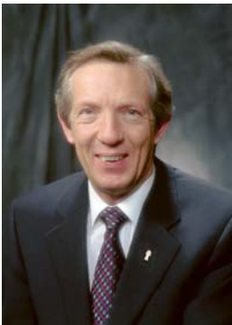
Lorne Calvert Premier Ministre, Saskatchewan

Bienvenue à tous. Je vous souhaite une conférence couronnée de succès et une année centennale débordante de santé, de bonheur et de célébrations.